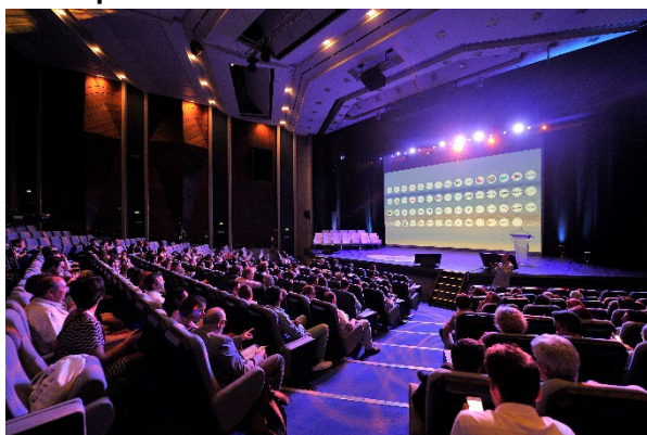
Auditorium du Palais