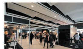
1 plateau d'exposition