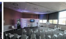
10 salles d'ateliers