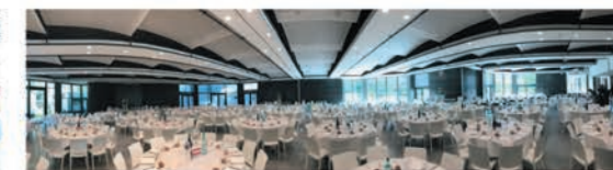
1 300 couverts possibles