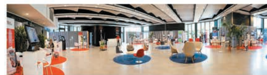
3 500 m 2 à la lumière du jour