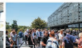
Terrasses et jardins