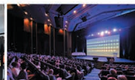
1 auditorium de 900 sièges